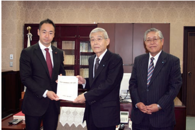
左から 鈴木副大臣、柳田税制委員長、松崎専務理事