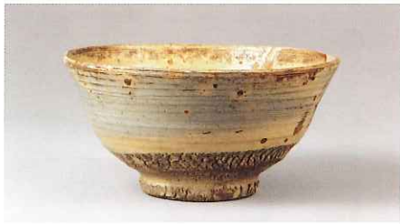
斗々屋茶碗 銘かすみ 朝鮮時代・16世紀