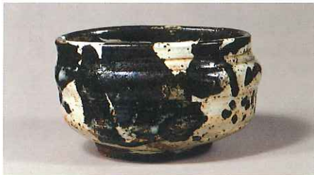
御所丸茶碗 朝鮮時代・17世紀