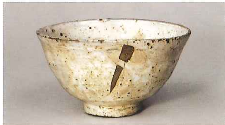
重要文化財 粉引茶碗 三好粉引 朝鮮時代・16世紀 (展示期間:7月9日～8月7日)