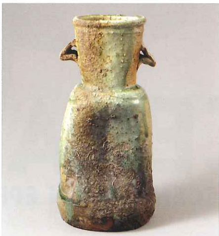
伊賀耳付花入 銘業平 桃山時代・17世紀