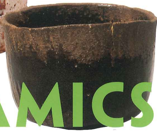
重要文化財 黒楽茶碗 銘雨雲 光悦作 江戸時代・17世紀 (展示期間:8月9日～9月19日)