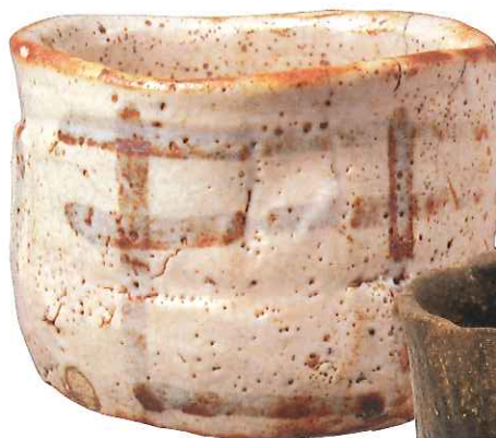
国宝 志野茶碗 銘卯花塙 桃山時代・16～17世紀 (展示期間:7月9日～8月7日)