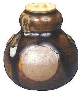
薩摩雨十瓢筆茶入 銘十寸鏡 江戸時代・17世紀