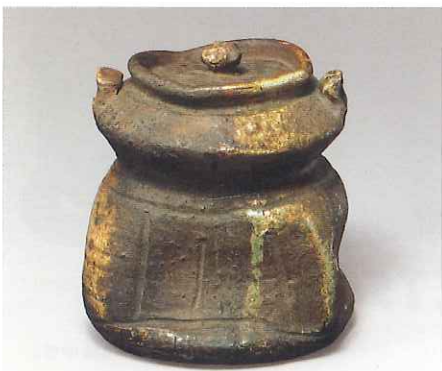
伊賀耳付水指 銘閑居 桃山時代・17世紀