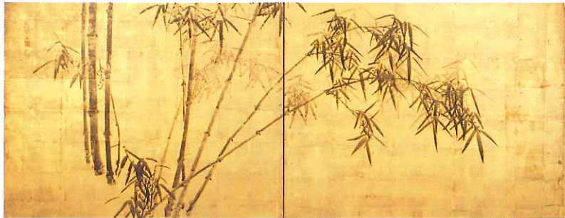
竹園風炉先屏風 円山応挙筆 江戸時代・18世紀