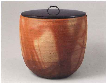
備前緋櫛水指 桃山時代・16～17世紀